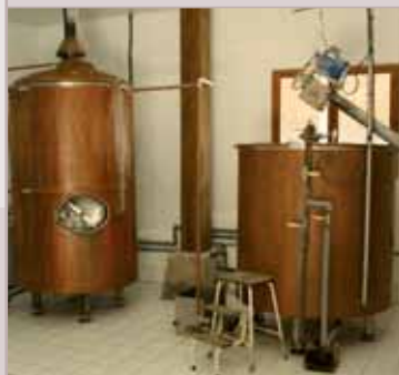
Fabrication de bières